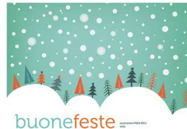
Neve sul bosco

Formato: aperto 23hx17l Area personalizzabile: lato interno dx e sx