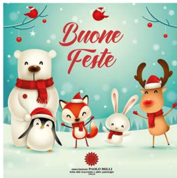
Natale nel Bosco

Formato: chiuso 15hx15l - aperto 15hx30l Area personalizzabile: lato interno dx e sx