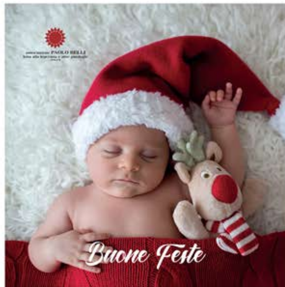
Natale nel Bosco

Formato: chiuso 15x15l - aperto 15x30l Area personalizzabile: lato interno dx e sx